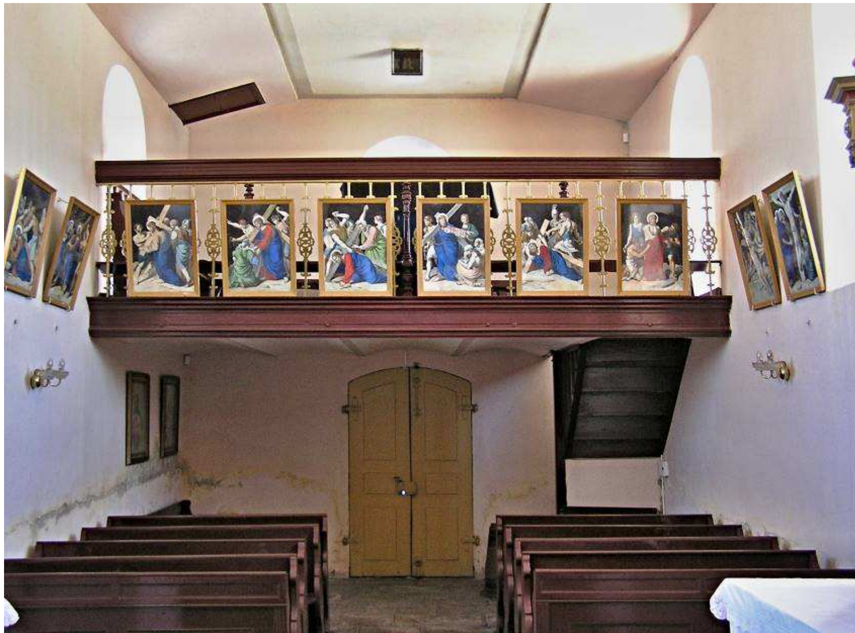
Interiér vzadu – okolo lodi 14 obrazů křížové cesty: